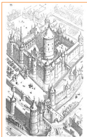
Figure 2 : Château du Louvre

▶ Le donjon devient circulaire pour améliorer la défense.