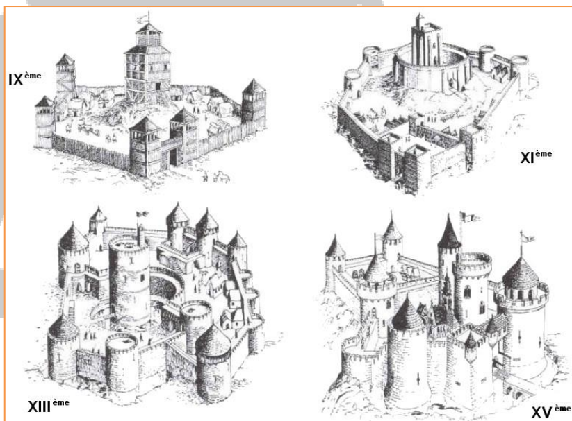
Figure 3 : Evolution du château fort

Petit à petit, la fonction résidentielle des châteaux est privilégiée. Les ponts-levis sont remplacés par des ponts fixes en pierre. Les bâtiments situés dans la cour sont percés de fenêtres à meneaux. Parfois de nouveaux bâtiments sont construits ou d'autres, simplement remaniés.