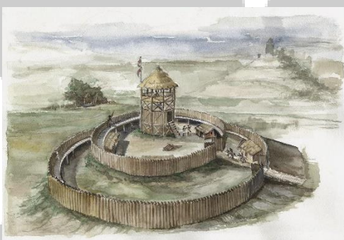
Figure 1 : Motte féodale, Plougras (Bretagne)

régions frontalières très exposées. La violence ambiante incite tous ceux qui en ont les moyens à fortifier leur château. Le choix du matériau ne dépendant que des moyens du commanditaire, les châteaux en pierre coexistent avec les châteaux en bois. Les fortifications en pierre, encore rare au x e siècle, correspond souvent à une construction romaine plus ou moins modifiée