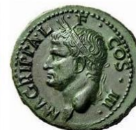
Tête avec couronne rostrale, buste nu