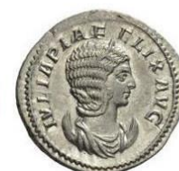
Tête avec diadème, buste drapé et posé sur un croissant