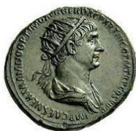
Tête radiée, buste drapé