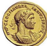
Tête laurée, buste cuirassé avec aegis sur l'épaule gauche