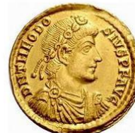
Tête avec diadème composé de perles et de rosettes, buste drapé et cuirassé