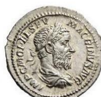
Tête laurée, buste drapé et cuirassé