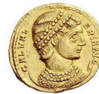
Tête avec diadème de perles, buste drapé avec collier de perles