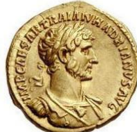
Tête laurée, buste cuirassé avec l'aegis au milieu de la cuirasse, drapé sur l'épaule gauche