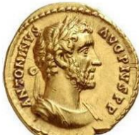
Tête laurée et buste cuirassé