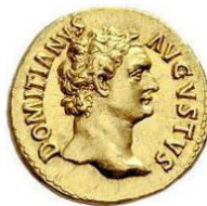
Tête nue et buste nu