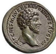
Tête nue, drapé sur l'épaule gauche