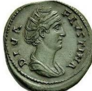
Tête avec les cheveux enroulés et attachés sur le dessus de la tête avec des doubles bandes de perles, buste drapé