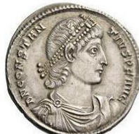
Tête avec diadème de perles, buste drapé et cuirassé