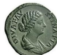
Tête nue, buste drapé