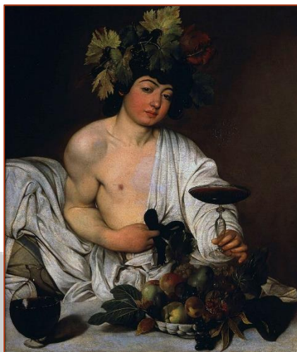
Figure 2 : Bacchus, Tableau de Caravage (1590 ?)

Il devint alors le dieu de la vigne, du vin, des festivités, de la danse, de la végétation, des plaisirs de la vie et de ses débordements.