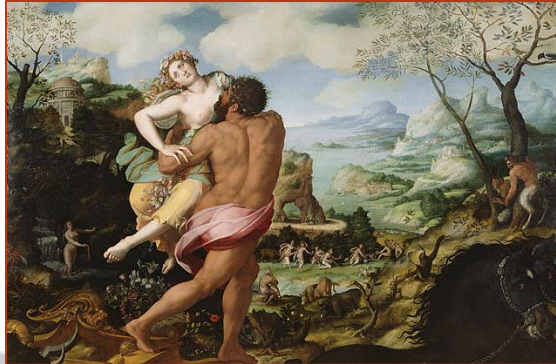
Figure 6 : Enlèvement de Proserpine Alessandro Allori (1570)

Jupiter prit une décision. Proserpine devait passer la moitié de l'année avec sa mère et l'autre moitié avec son mari, le dieu Pluton, au royaume des Enfers.