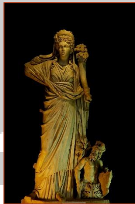
Figure 7 : Tomis Fortuna, musée de Constanța

Déesse italique très ancienne, Fortuna est d'abord considérée comme une divinité de la fertilité, dispensatrice de prospérité, avant d'être progressivement associée au