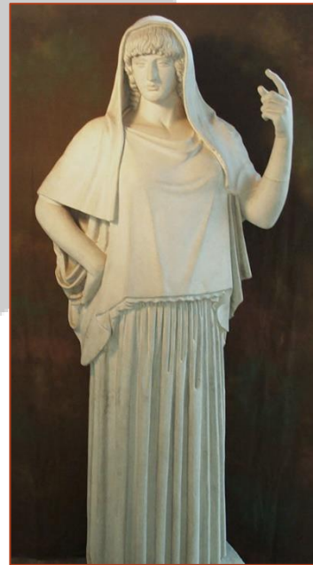
Figure 5 : copie romaine (II e siècle) d'un original grec d'Hestia Giustiniani de -460 au musée Torlonia de Rome.

Les Romains sacrifiaient au temple de Vesta avant toute intervention importante.