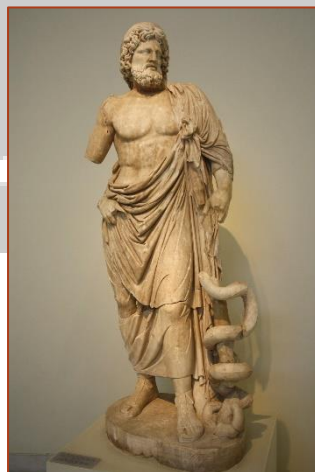
Figure 1 : Statue d'Asclépios (musée d'Athènes)

Cependant, un jour un homme lui offrit une fortune s'il ressuscitait un mort. Esculape accepta et rendit la vie à Hippolyte, le fils de Thésée. Les dieux furent offensés et Zeus ne voulant pas tolérer qu'un