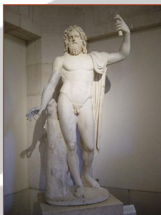
Figure 9 : Représentation de Jupiter au musée du Prado, à Madrid.

Saturne exigea de son épouse qu'elle lui remît ses nouveaux nés, et il les dévorait. Mais Cybèle par ruse parvint à sauver Jupiter et le fit nourrir et élever par deux nymphes.