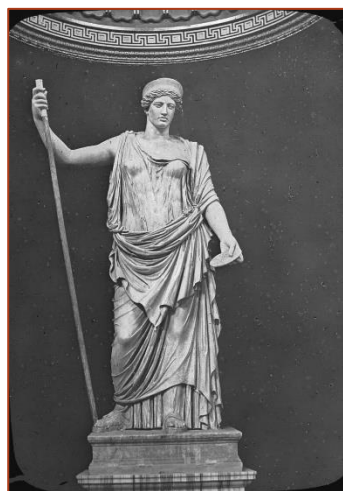
Figure 10 : Junon au Musée du Vatican, à Rome.

Elle ourdit un complot avec Neptune et Minerve pour détrôner le dieu Jupiter. Mais son dessein échoua.