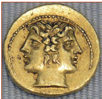
Figure 8 : Demi-statère de Rome, montrant les deux visages du dieu Janus, ca. - 217.

Janus s'y installa avec sa femme Camisè et y eut des enfants.