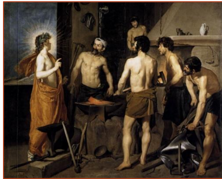
Figure 4 : Les forges de Vulcain par Velazquez

Junon honteuse d'avoir donné naissance à un enfant difforme et laid le jeta dans la mer.