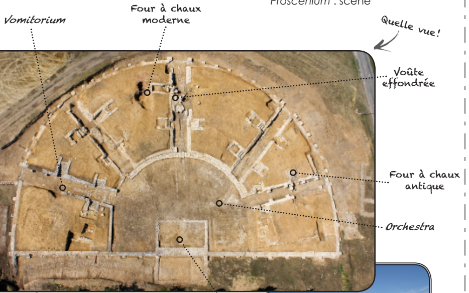
Le théâtre vu du ciel